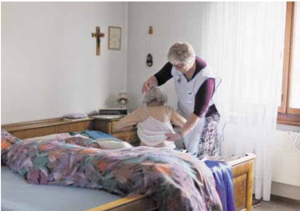
Eine grosse Herausforderung, auch finanziell: die Pflege von Seniorinnen und Senioren.

die vollen Kosten zu decken, wie dies einige Leistungserbringer fordern.» Vielmehr gehe es darum, die notwendige gute Qualität zu einem angemessenen Preis einzukaufen. Obwohl die von der IG geforderte stärkere Kostenbeteiligung der Krankenkassen die öffentlichen Finanzen entlasten würde, zeigt sich Leutwyler skeptisch: «Wir dürfen nicht vergessen, dass unsere Bürger nicht nur Steuer-, sondern auch Prämienzahler sind.»